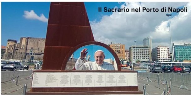
Il Sacrario nel Porto di Napoli

Ore 19.30 - Preghiera e accensione dei lumini in ricordo di Papa Francesco sul Sacrario con le urne delle vittime delle guerre, delle “Città - martiri”, dei migranti morti nel mare e dei bambini morti per fame.