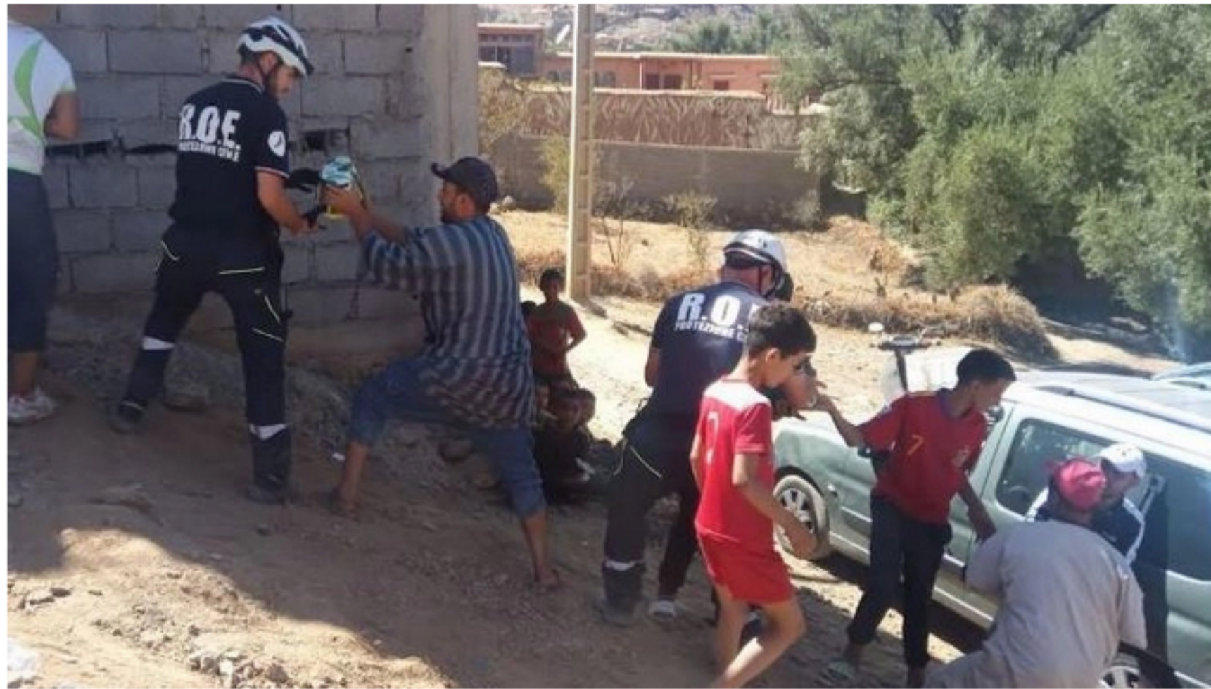
I volontari del Roe distribuiscono viveri alle popolazioni colpite dal terremoto in Marocco

"Assolutamente sì, siamo qui in forma privata e lo Stato italiano non c'entra nulla. Facciamo quello che è il nostro dovere in momenti come questi".